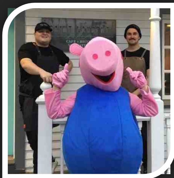
La mascotte Gasporc au Bistro St Laurent

Commentaires à: boucherville@goute-boudin-quebec.ca