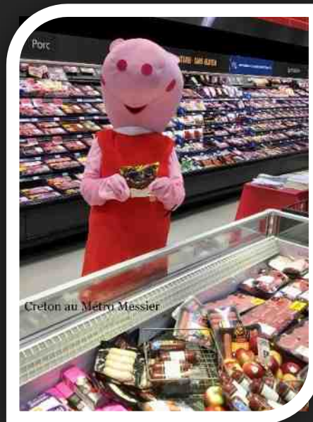
Creton au Metro Messier